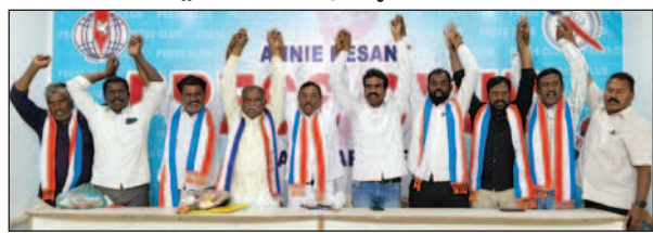
మదనపల్లె, జనవరి 31 ప్రభాతవార్త :