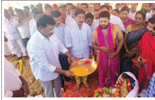
రైల్వేకోడూరు అర్బన్, జనవరి 31, ప్రభాతవార్త: