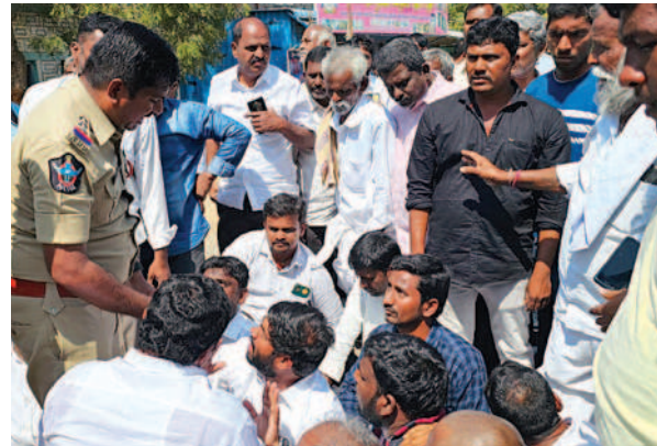
ముద్దనూరు, జనవరి 31, ప్రభాతవార్త