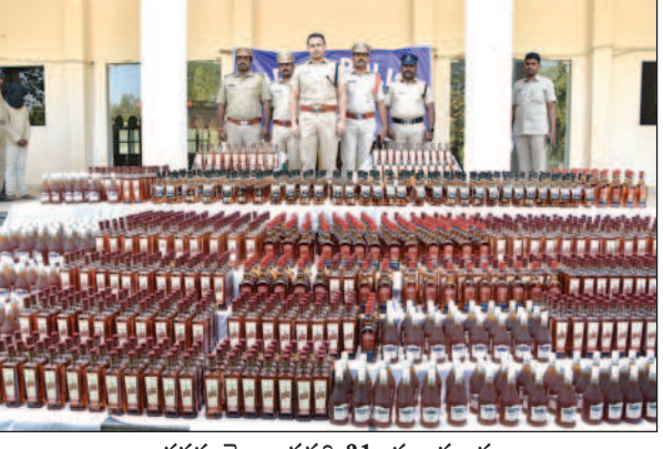
కడప జైం, జనవరి 31, ప్రభాతవార్త: