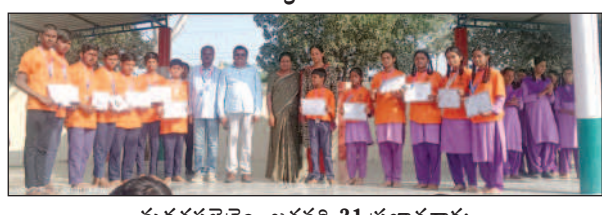
మదనపల్లె, జనవరి 31 ప్రభాతవార్త :