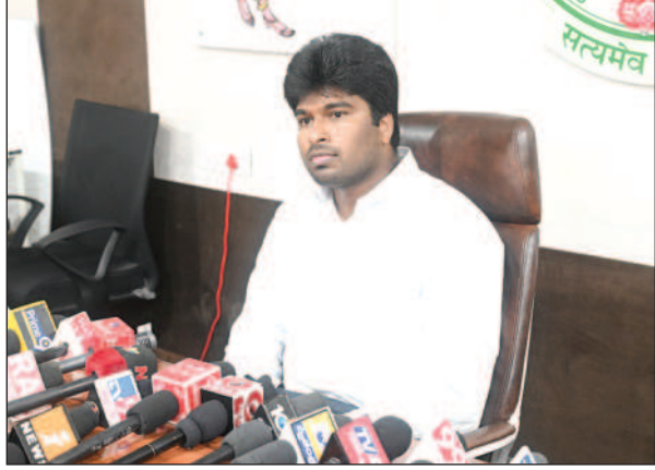
రాయచోటి, జనవరి 31, ప్రభాత వార్త :

- రాబోయే ఎన్నికలు సజావుగా జరిపిస్తా - ప్రజా సమస్యలు సత్వరం పరిష్కరిస్తా - నూతన కలెక్టర్ అభిషిక్త కిషోర్