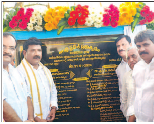
రైల్వేకోడూరు రూరల్, జనవరి 31 ప్రభాతవార్త